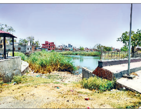
बवानी खेड़ा। पंडित दीनदयाल उपाध्याय झील की बद्दहली पर विरोध प्रदर्शन करते क्षेत्रवासी तथा पंडित दीनदयाल उपाध्याय झील की बद्दहल स्थिति, उसके अंदर उगी घास व फैली गंदगी।