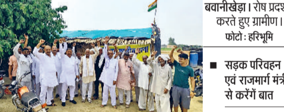
बवानीखेड़ा। रोष प्रदर्शन करते हुए ग्रामीण।

बडसी से मिलकपुर हाइवे पर एनएचआई 148बी हॉसी से भिवानी मार्ग के निर्माण में मिलकपुर, दुर्जनपुर, बडसी जाटान, बडसी गुजराण, चौरटापुर, सिक्करपुर, जीता खेड़ी, ढाणी कंसला आदि के ग्रामीणों की मांगें पूरी न होने को लेकर उनका धरना प्रदर्शन जारी है। वहीं ग्रामीणों ने भारत सरकार में सड़क परिवहन और राजमार्ग मंत्री नितिन गडकरी से मिलने का एजेंडा तैयार कर लिया है ताकि उनकी मांगों को पूरा करवाया जा सके। पंचायतों