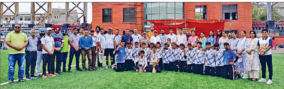
बवानीखेड़ा। अंबाला में आयोजित प्री. सुब्रतो में अपनी जगह बनाने की खुशी में मौजूद खिलाड़ी।