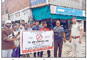
बवानीखेड़ा। नशे की रोकथाम के लिए प्रेरित करते हुए।