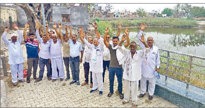
बवानी खेड़ा। पंडित दीनदयाल उपाध्याय झील की बद्दहली पर विरोध प्रदर्शन करते क्षेत्रवासी तथा पंडित दीनदयाल उपाध्याय झील की बद्दहल स्थिति, उसके अंदर उगी घास व फैली गंदगी।

बद्दहली का शिकार अब इसे झील कहेंगे या तालाब ये सोचने और देखने वाली बात है। उल्लेखनीय है कि बाबा कमाल तालाब से पंडित दीनदयाल झील बनाने के लिए सरकार ने करोड़ों रुपये खर्च किए, इसके बावजूद ये न तो झील बनकर तैयार हुई, जिसमें कस्बावासी आनंद उठा सकें और न ही ये वर्षों पुरानी तालाब बना रह सका। इसको लेकर कस्बावासी अनेक बार विरोध प्रदर्शन व धांधली की जांच करवाने की मांग कर चुके, लेकिन